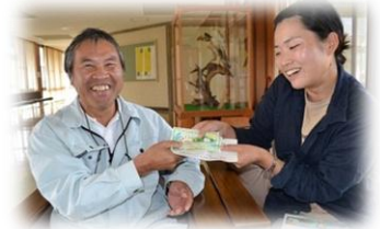
地域通貨でお買い物

山に放置されたままの間伐材等（林地残材）を運び出し、地域通貨で買い取ることで、地元の商店と森を元気にする活動。2009年に恵那市で開始後、全国30数ヶ所で実施中。林地残材の利活用・地域の景気浮揚・木質エネルギー利用を通じた地域内エネルギーの地産地消に効果を上げている。