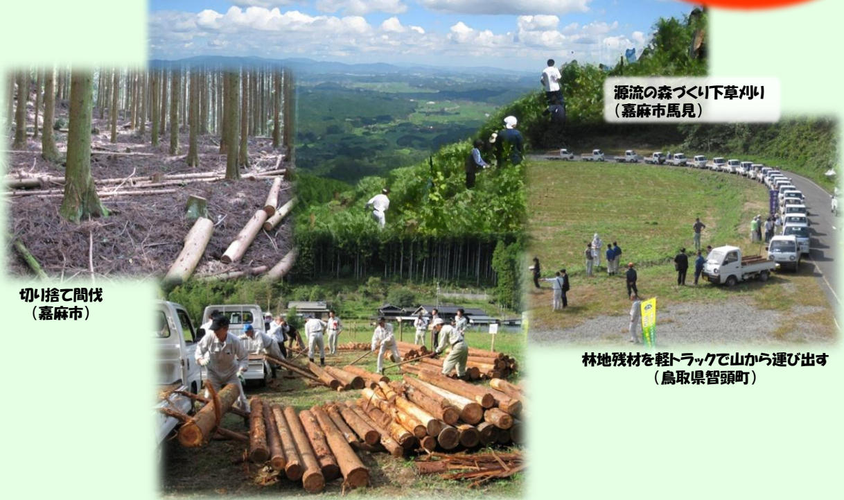
切り捨て間伐 (嘉麻市)